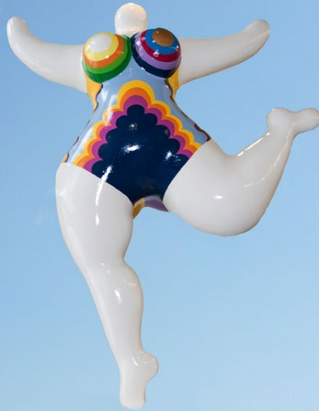
Skulptur Nana von Barbara Löschner